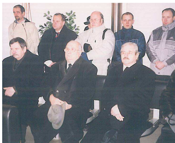
Pri poslednom stretnutí ...