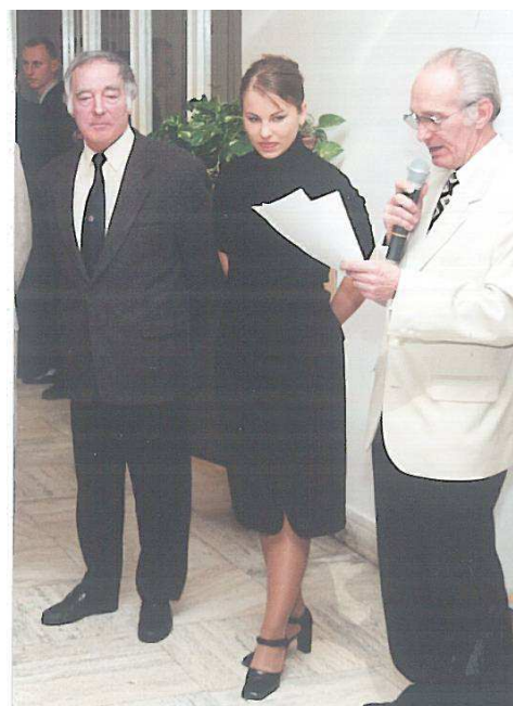
Preberal aj pocty.